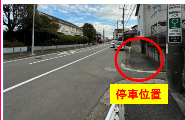
⑫サンベルテ戸塚向かい