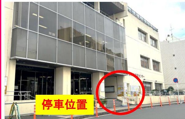
乗車場所 戸塚図書館前