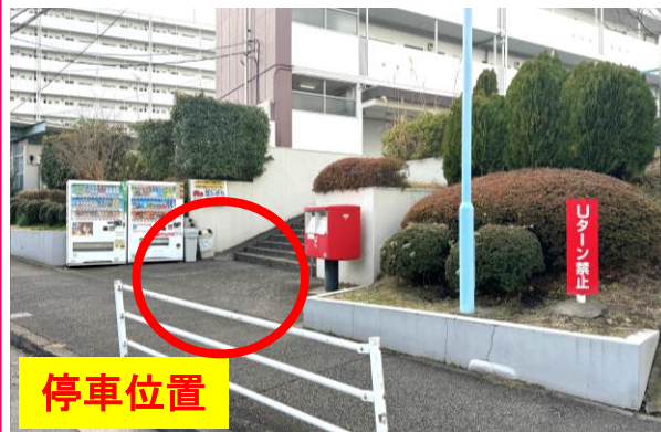
⑧ぐみさわ東ハイツ集会所