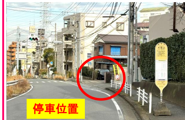
⑩大坂上バス停付近