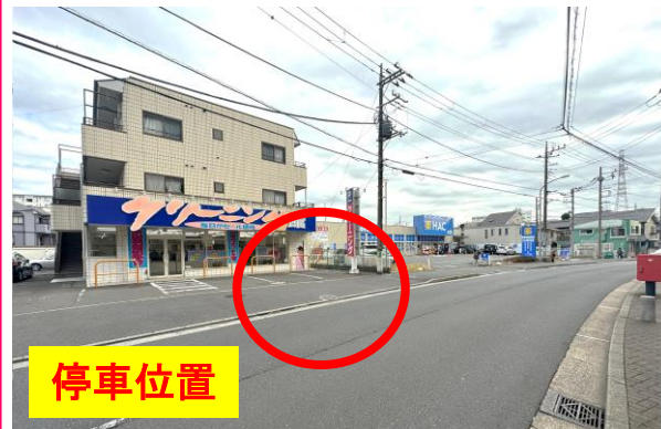
③ハックドラッグ・ クリーニング屋さん前