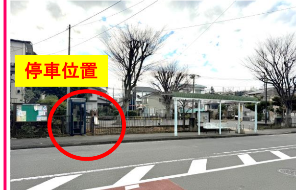
⑤汲沢団地バス停付近 (汲沢第2公園)