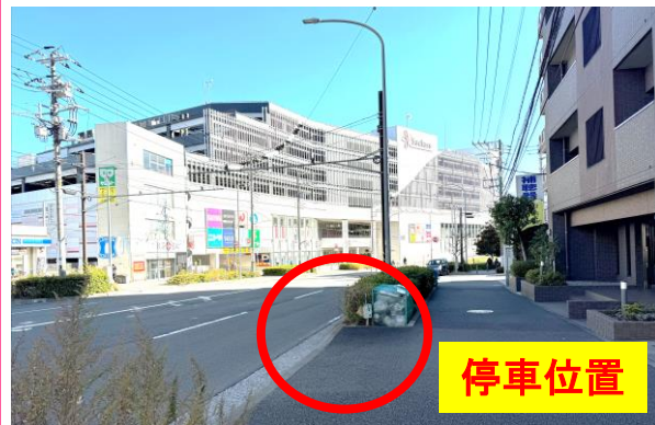
②サンヴェール戸塚