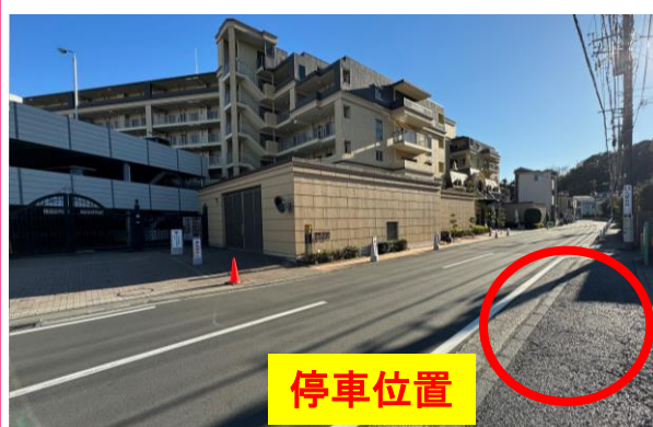
⑬グランシティ・パレ・ド・ リヴァージュ向かい